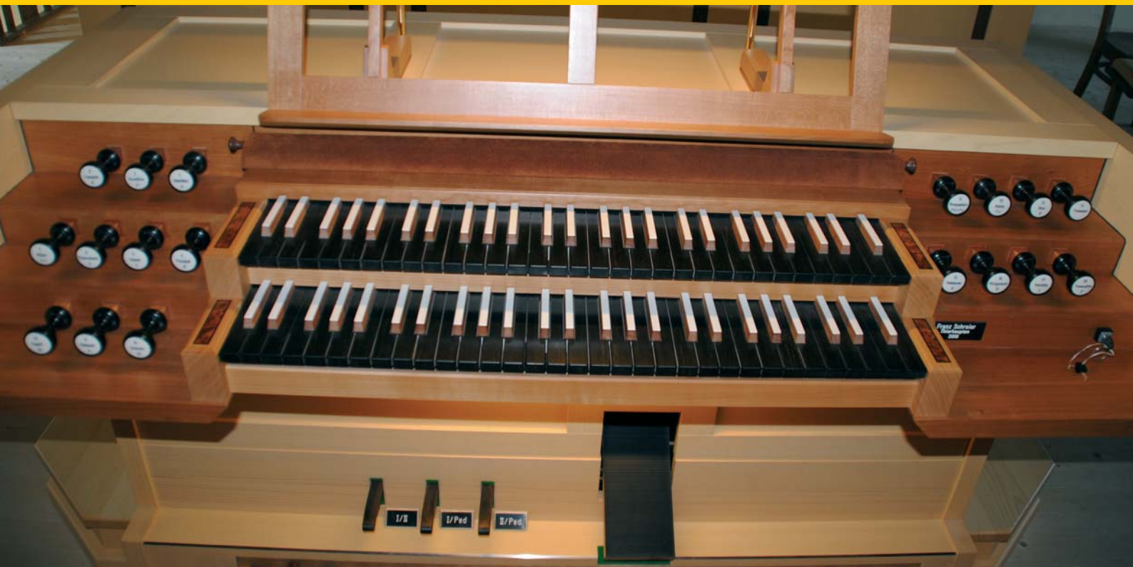
Einblicke in das Innenleben der neuen Orgel