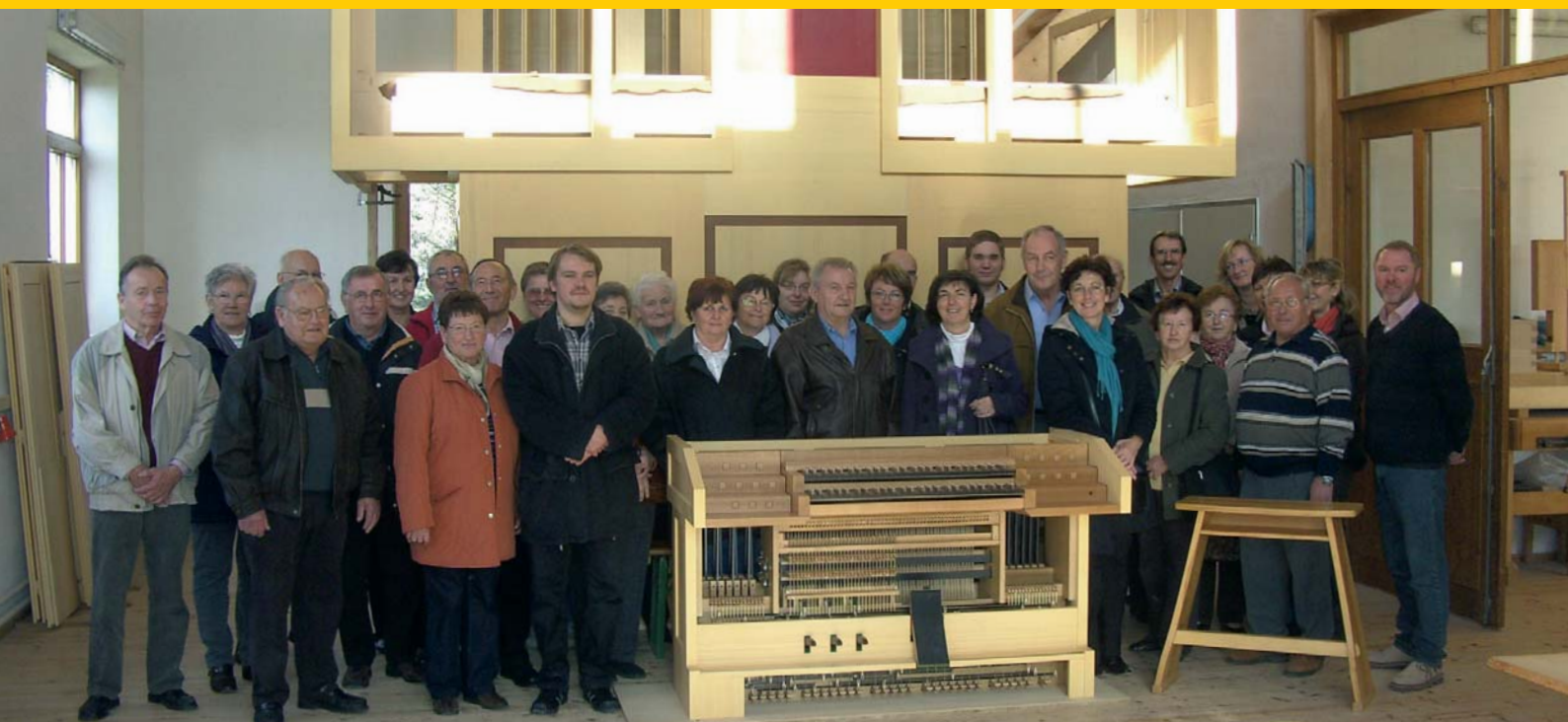
Besuch beim Orgelbauer in Thierhaupten im November 2009